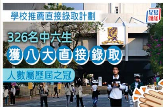
供中六學生參與的第三屆學校推薦直接錄取計劃 (SNDAS) 於上月公布結果。資料圖片

供中六學生參與的第三屆學校推薦直接錄取計劃 (SNDAS) 於上月公布結果。教育局昨公布具體數字，今屆有逾400間中學合共提名逾770人，最終向332名中六學生發出直接錄取通知，較上屆多近3成，參與學校數目、提名及取錄人數均創歷屆之冠，其中326人接受取錄，錄取最多學生的學科範疇包括理學、商科、醫學與健康、計算科學與工程等。